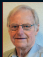
Stocker Franz Grossvater